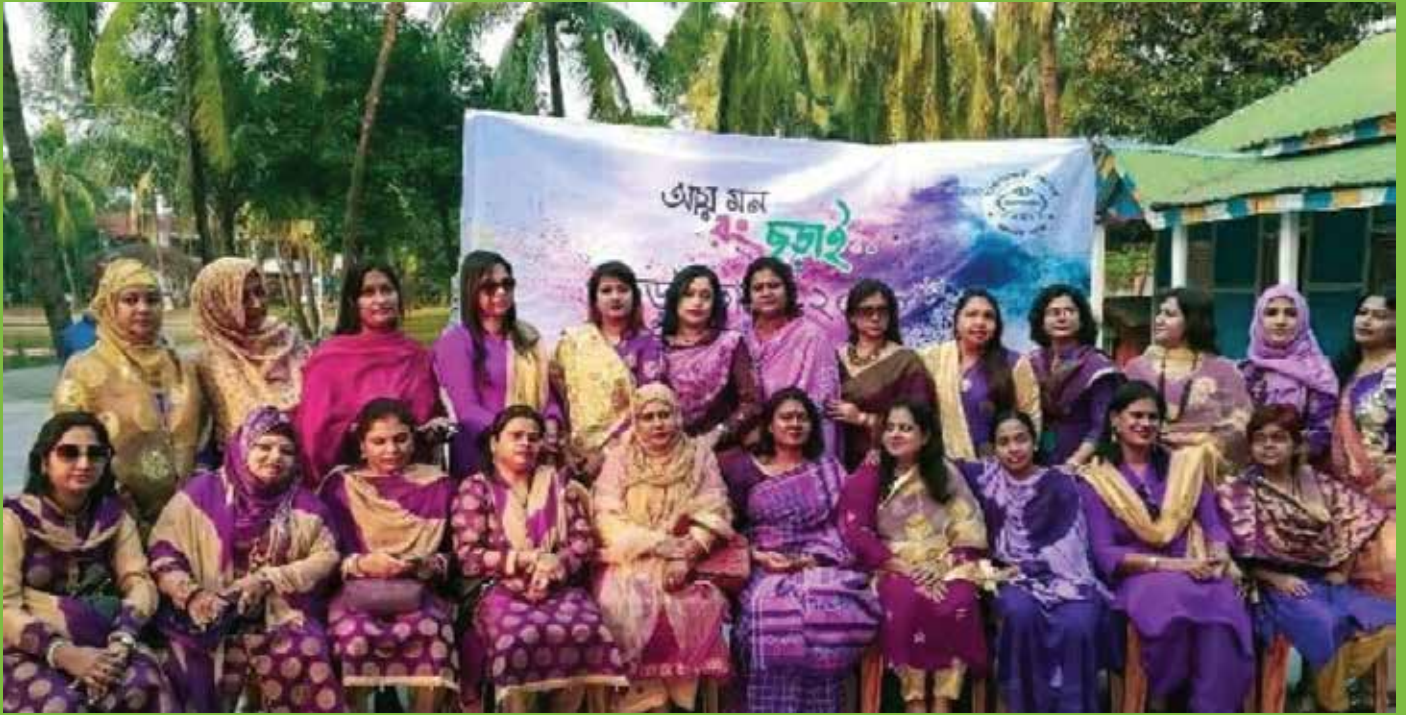
Photo : Bharateshwari Homes SSC 1994 Batch. Picnic 2018, Dolly Nibash, Narayanganj.